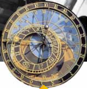
Reloj astronómico, localizado en la ciudad de Praga, República Checa. Fue construido en el siglo XV.