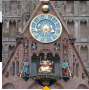
«El corredor», reloj creado en 1509 que cada día y cada noche rinde homenaje al emperador Carlos IV. Está localizado en la ciudad de Nuremberg, Alemania