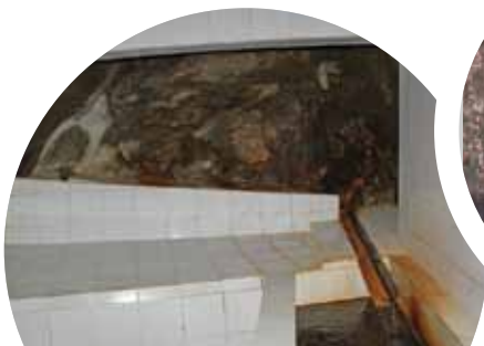
Manantial en el estado Miranda