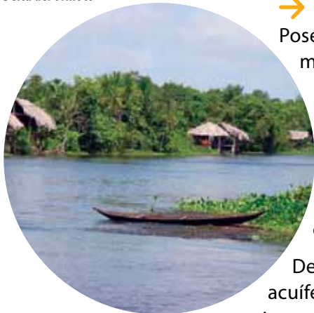
Delta del Orinoco

→ Venezuela tiene una hidrografía abundante y muy diversa.