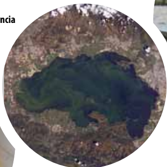
Lago de Valencia

Uno de los mayores atractivos turísticos de Venezuela son sus extensas playas en el mar Caribe.