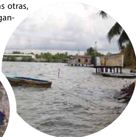
Lago de Maracaibo