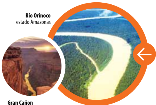
Río Orinoco estado Amazonas

Los ríos excavan valles , cañones y cuevas. También forman estuarios , deltas y playas cuando desembocan al mar.