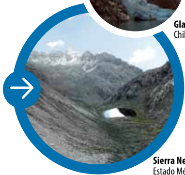
Sierra Nevada Estado Mérida

Los glaciares son flujos de hielo que fragmentan y arrastran rocas, excavando valles en las montañas.