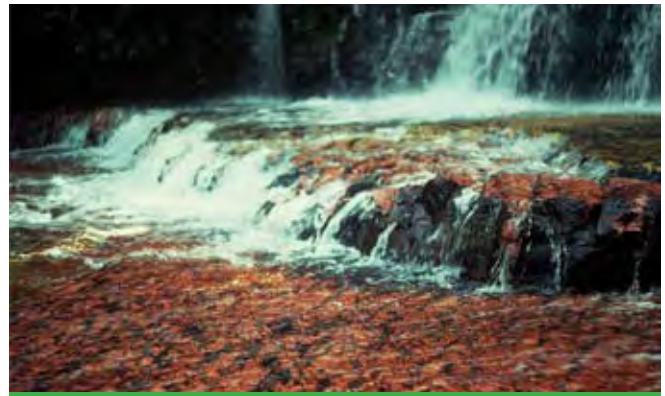
Quebrada de Jaspe

A= Alojamiento. 1= Kusari-tepui. 2= Kuravaina-tepui. 3= Tepochi-tepui. 4= Auyan-tepui. 5= Río Carrao. 6= Mayupa. 7= Moroco. 8= Salto Ucaima. 9= Salto Golondrino. 10= Salto Hacha. 11= Salto Sapo. 12= Salto Sapito. 13= Salto Ara. 14= Isla Anatoly