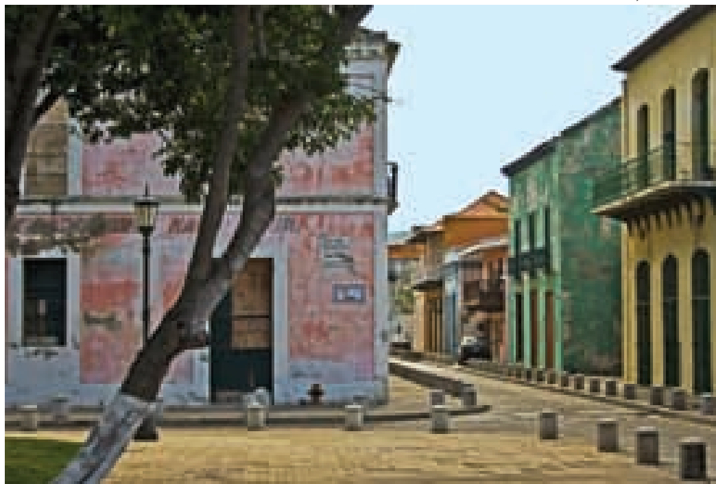
Puerto Cabello, estado Carabobo.

La distribución de los espacios hace que el aire circule con dificultad, lo que aumenta el calor en sus espacios interiores. Los balcones ofrecen una gracia al perfil urbano. En la costa central, a diferencia de otras partes del país, algunas casas coloniales son de dos pisos.