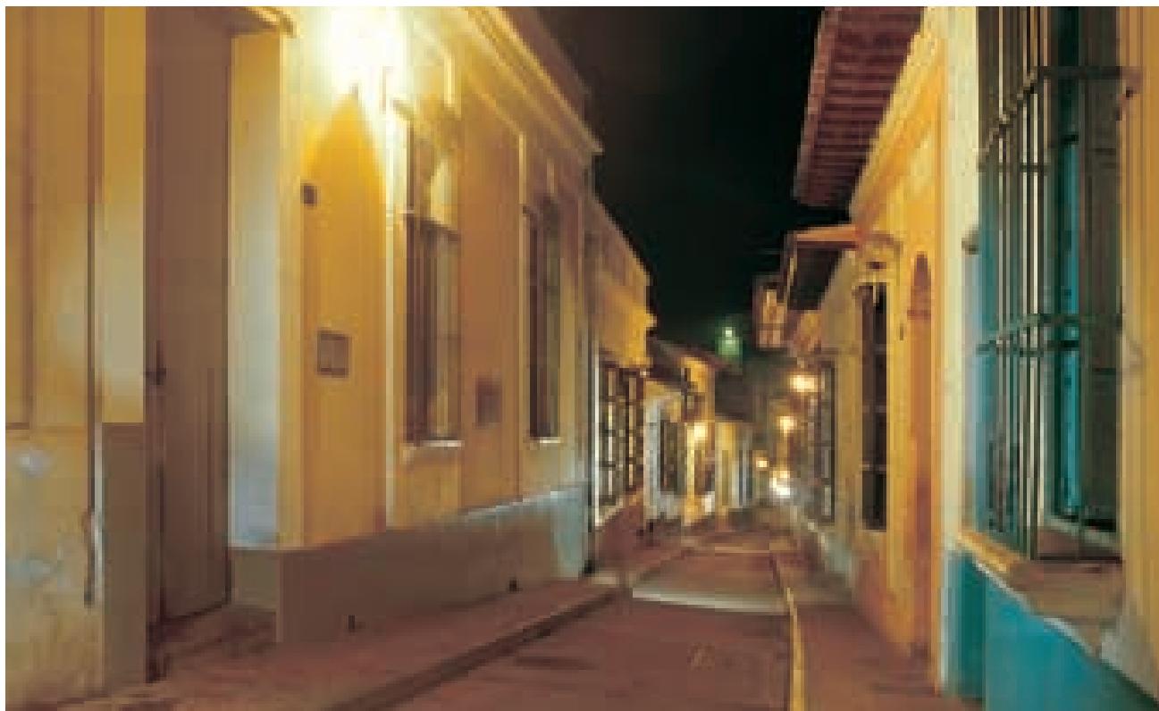
Calle de La Guaira, estado Vargas.