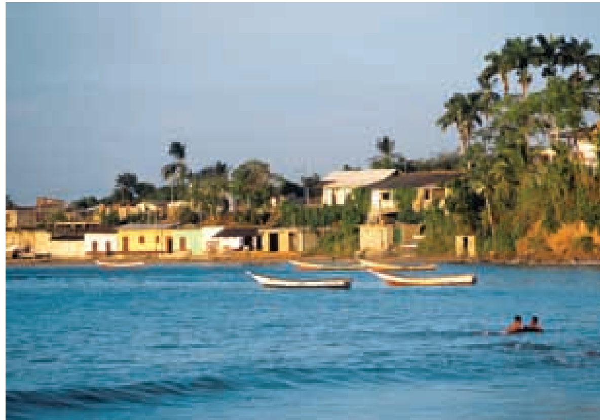
Península de Paria, estado Sucre.