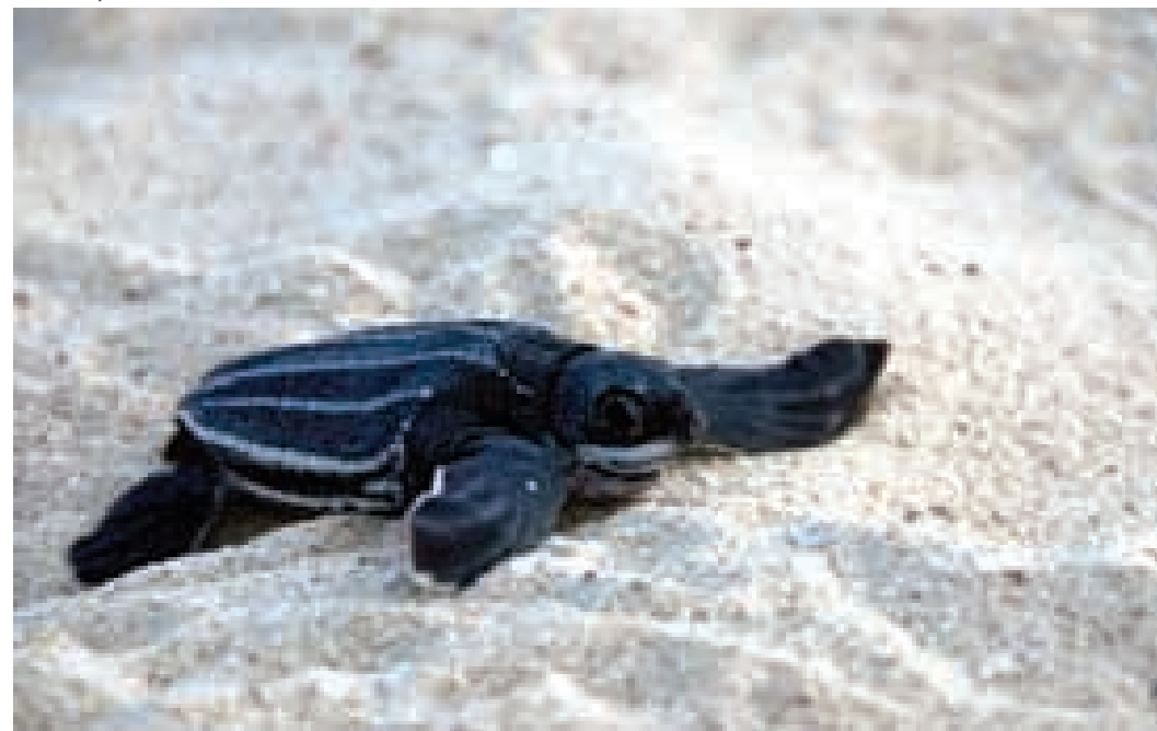
Tortuga cardón ( Dermochelys coriacea ).