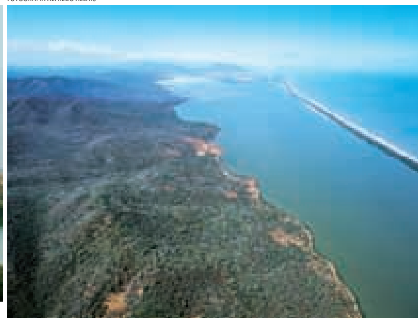
Laguna de Píritu, estado Anzoátegui.