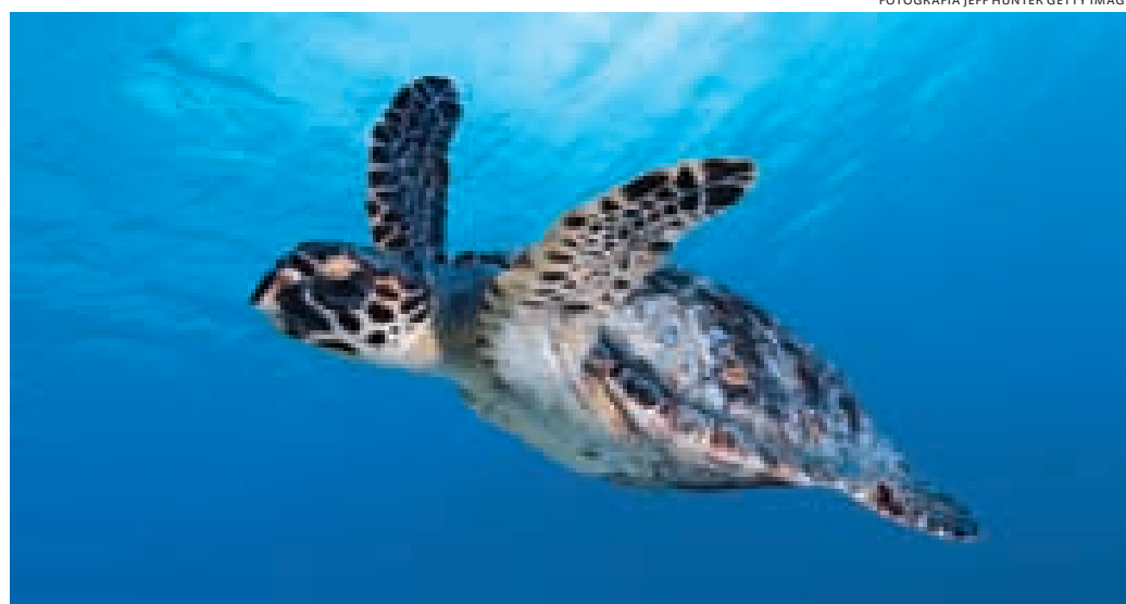
Tortuga Carey ( Eretmochelys imbricata ).