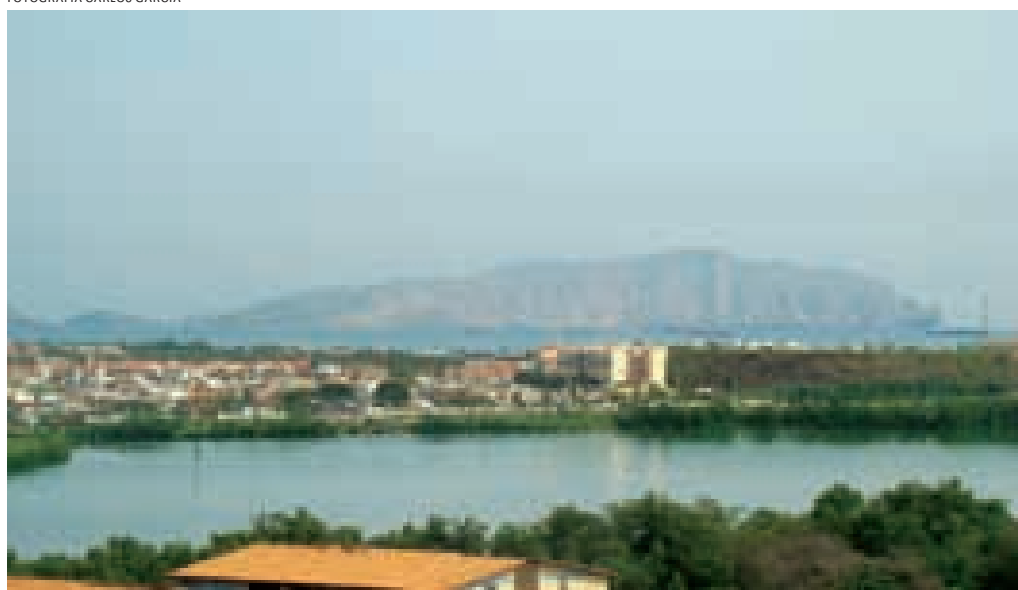
Laguna El Maguey, estado Anzoátegui.