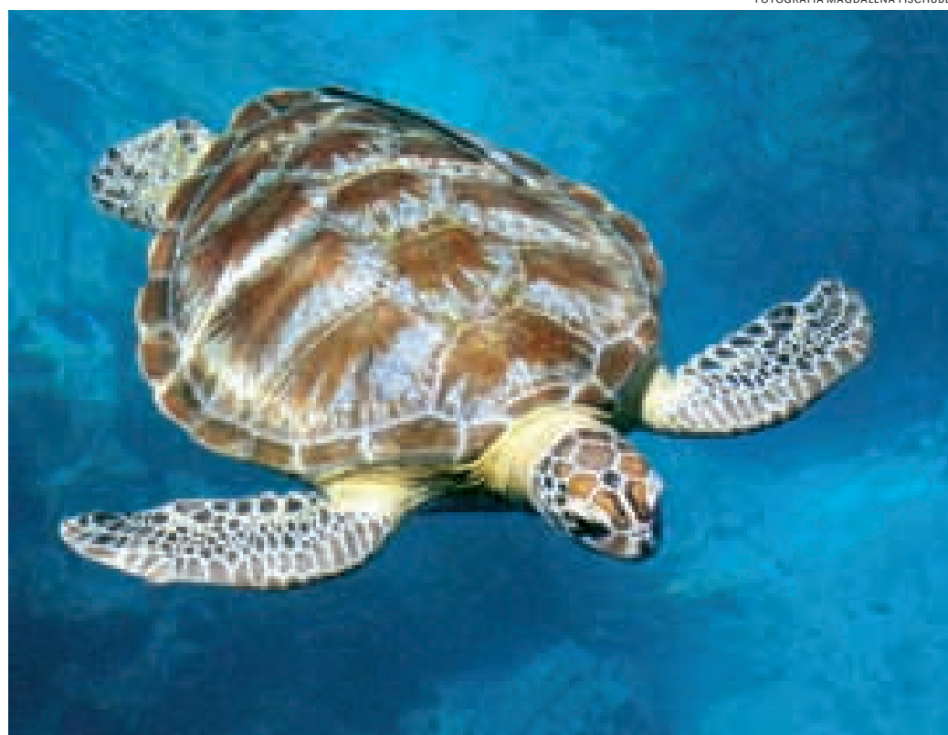
Tortuga verde ( Chelonia mydas ).