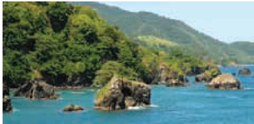
Bahía del Pueblo de Santa Isabel, Parque Nacional Península de Paria.