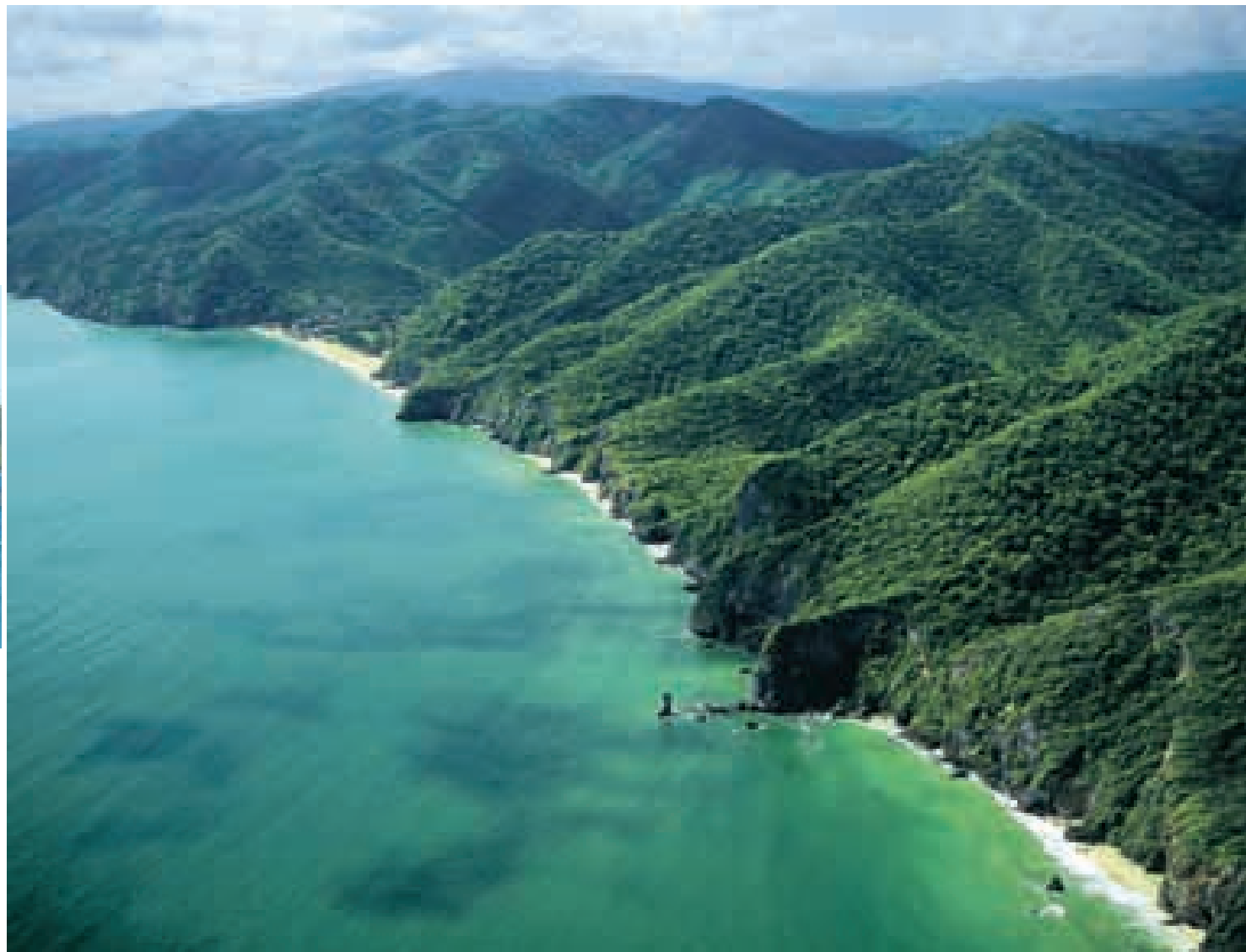
Parque Nacional Península de Paria.