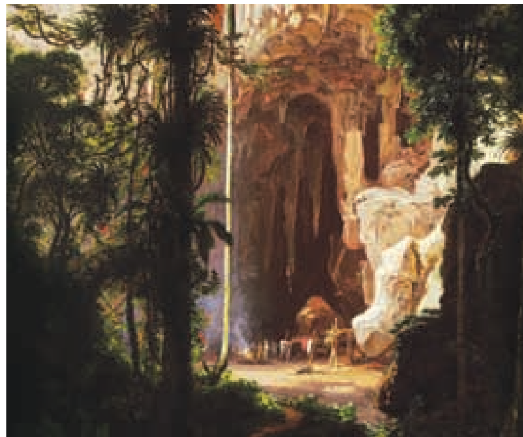
Ferdinand Bellermann. La cueva del Guácharo, 1843.

El Gran Turimiquire posee valiosos ecosistemas, ricos en biodiversidad y endemismos. Permite asegurar el abastecimiento de agua en las regiones nororiental e insular del país, y en él se encuentran las nacientes de los ríos Guarapiche, Caripe y Carinicua-Cariaco; también importantes embalses y acueductos regionales y locales. En sus inmediaciones se localizan plantaciones de café. Muchas de sus áreas presentan impactos ambientales considerables, y en gran parte de las zonas bajas y medias la vegetación natural ha sido fuertemente intervenida por la agricultura y degradada hacia sabanas antrópicas y matorrales.