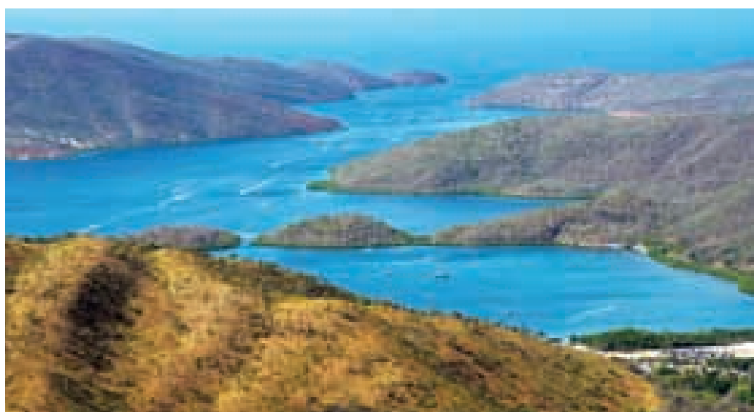
Bahía de Mochima.

Este hermoso parque protege extensas áreas marinas, costas que incluyen 6 golfos, 16 bahías, 121 playas y 6 archipiélagos rocosos, y una zona montañosa que abarca parte del macizo del Turimiquire, con valiosos ecosistemas áridos y boscosos con varios endemismos. Sus playas de aguas cristalinas están bordeadas por arenas que van del blanco puro al rojo ladrillo, con una variada diversidad marina, donde destacan abundantes delfines, que son una atracción turística.