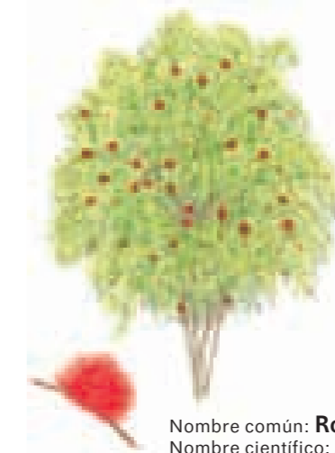
Nombre común: Rosa de monte Nombre científico: Brownea coccinea Altura: 3-7 m Unidad de vegetación: Bosque subsiempreverde montano Detalle: Flores Piso: Montano Franja: Montana (4) ILUSTRACIONES MERCEDES MADRIZ