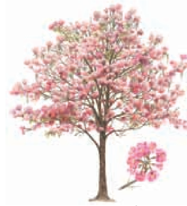
Nombre común: Apamate Nombre científico: Tabebuia rosea (Bertol.) DC. Altura: 10-30 m Detalle: Flores Unidad de vegetación: Bosque semicaducifolio submontano estacional Piso: Montano Franja: Submontana (3 y 5)

El descenso en la vertiente sur de la serranía muestra cambios en la vegetación parecidos a los encontrados en el ascenso. Finalmente llegamos a una sabana cubierta de hierbas y pequeños arbustos. Y es que ya nos despedimos de esta región para entrar en los Llanos orientales.