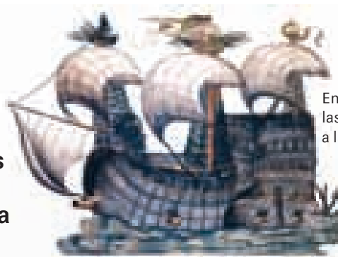
En febrero de 1529 llegaron las primeras naves de los Welser a las costas de la «Coriana».

Producción general: Ediciones Fundación Empresas Polar Asesor (lám. 83): Pedro Cunill Grau Autora: Maribel Espinoza Concepción de las estrategias de edición gráfica y proyecto de diseño: VACA Visión Alternativa