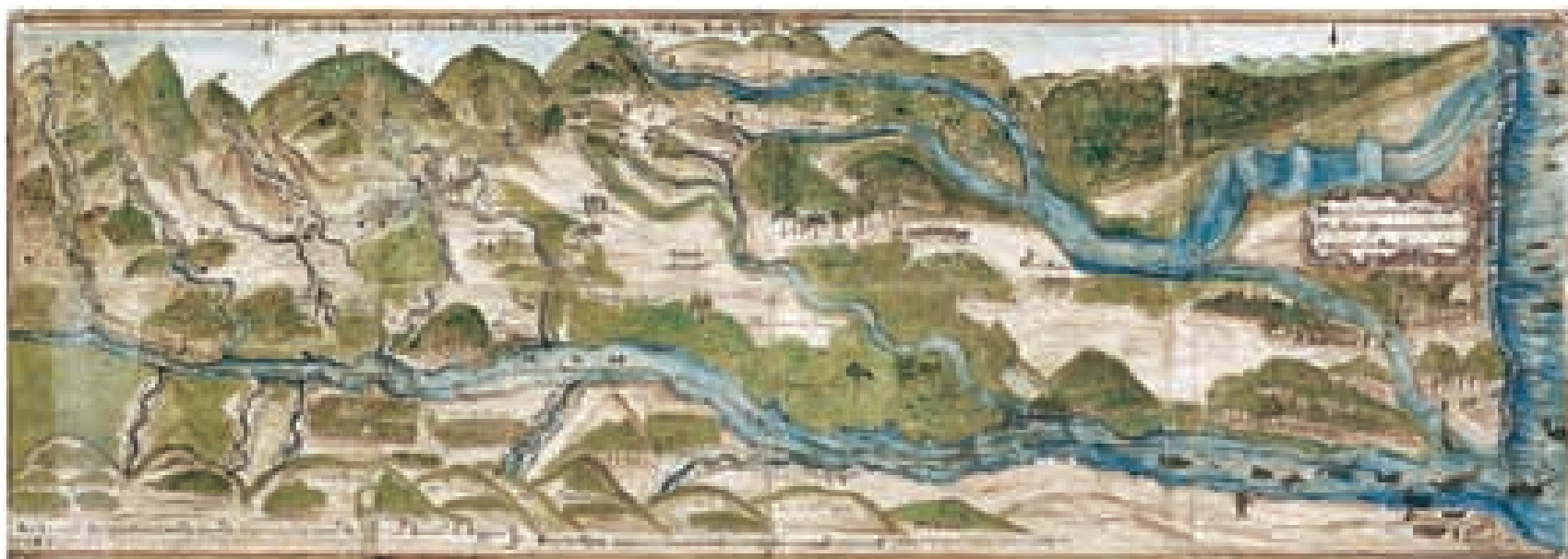
Mapa de San Felipe El Fuerte. San Felipe El Fuerte fue fundada en el año de 1729 y refundada a partir de 1812, tras su total destrucción por el terremoto del 26 de marzo de ese año.

El poblamiento del occidente de Venezuela tuvo uno de sus ejes en El Tocuyo, cuya importancia económica estuvo vinculada al cultivo de la caña de azúcar. Esta prosperidad, aunada a su jerarquía, permitió el florecimiento de un movimiento cultural, destacado por la música y una escuela de pintura cuyo principal exponente es el llamado «Pintor de El Tocuyo».