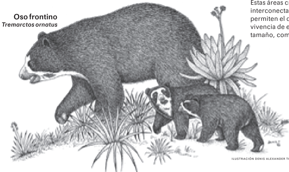
Oso frontino Tremarctos ornatus

Estas áreas creadas como un sistema interconectado de corredores biológicos, permiten el desplazamiento y la sobrevivencia de especies migratorias o de gran tamaño, como el oso frontino.