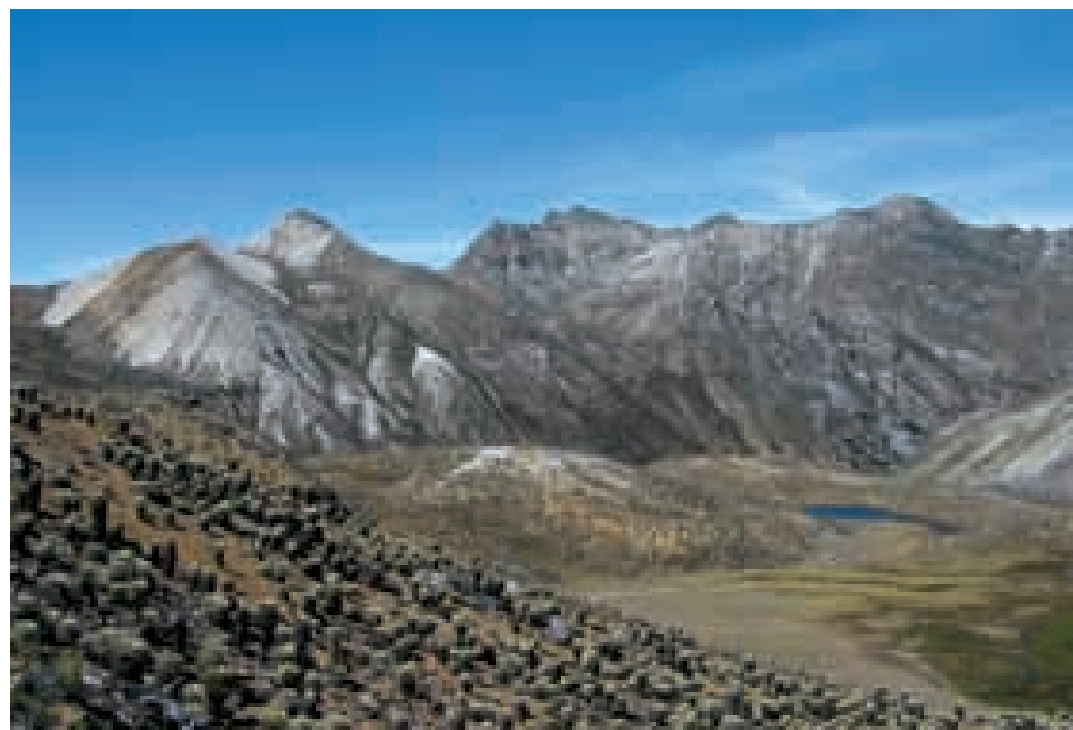
Vista del pico Piedras Blancas, máxima elevación de la sierra de La Culata.

visitar a los cóndores, ave emblemática del estado Mérida en grave peligro de extinción. También lo habitan el oso frontino, el puma, la candelita frentiblanca, y especies endémicas de reptiles, anfibios e invertebrados. Es vecino de varias zonas protectoras y del Monumento Natural Chorrera de Las González.