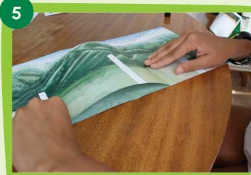
Coloca cada solapa en los espacios identificados con el N° 1 sobre la base. Mantenlas firmes hasta que sequen.