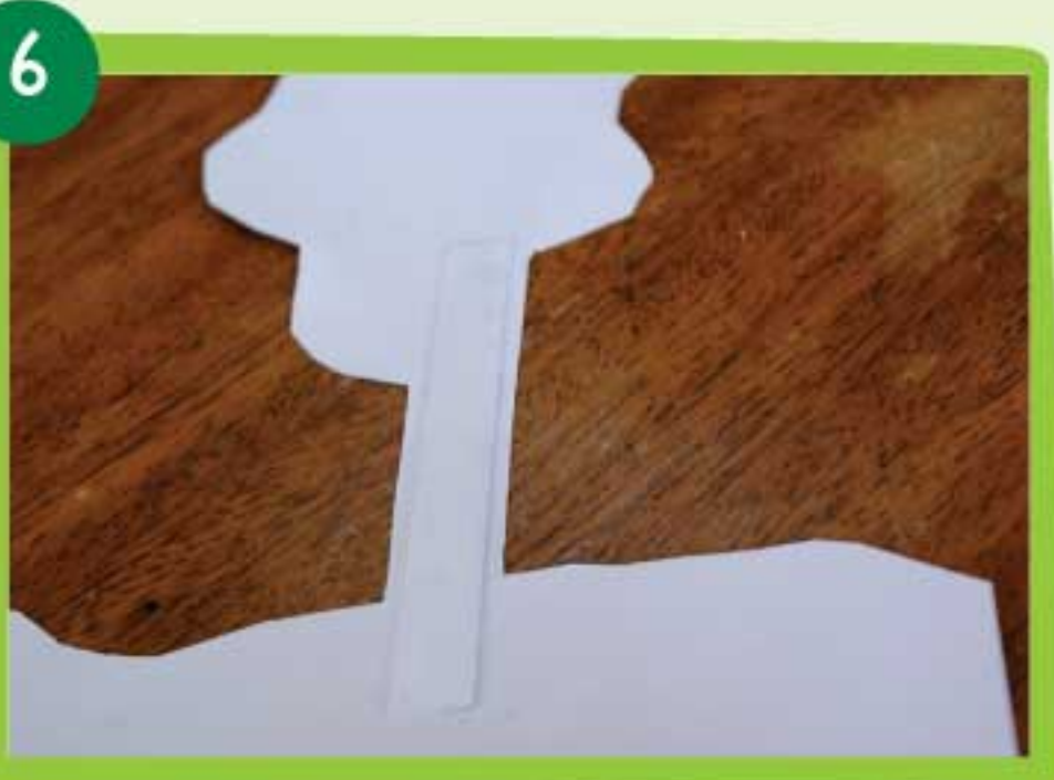
Luego de recortar la pieza Pittier 3 colócale el refuerzo de cartulina al árbol niño o cándelo por la parte trasera.

Sigue los pasos del 1 al 6 con cada una de las piezas del parque. Recuerda seguir el orden de numeración de las piezas. Recorta el Quetzal dorado y pégalo donde quieras.