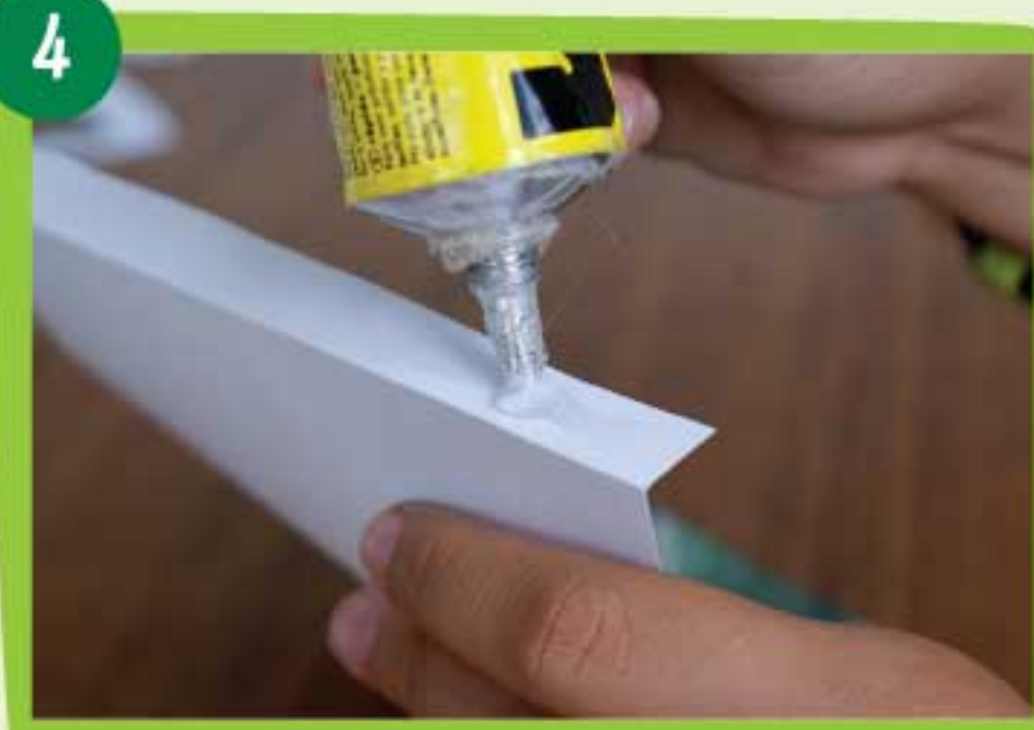
Coloca pegamento en el reverso de cada solapa de la pieza Pittier 1.