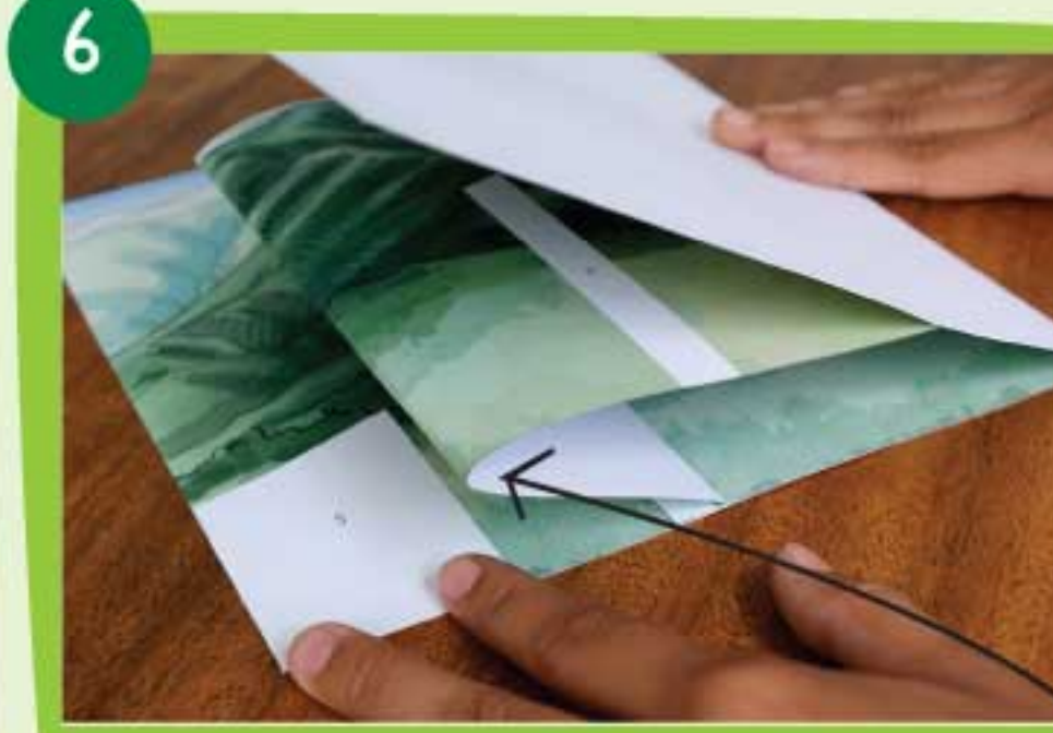
Dobla la base con cuidado hasta que logres comprimir la pieza Pittier 1 y generar el doblez en la mitad de ella.