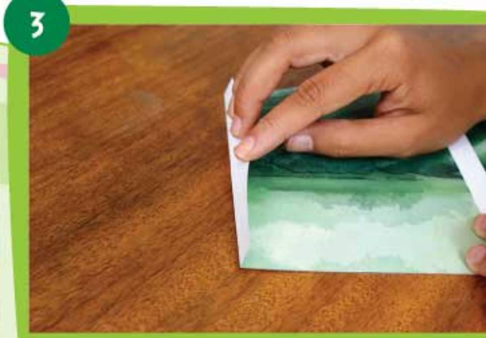
Realiza los dobleces de cada solapa de la pieza Pittier 1 siguiendo la línea punteada.