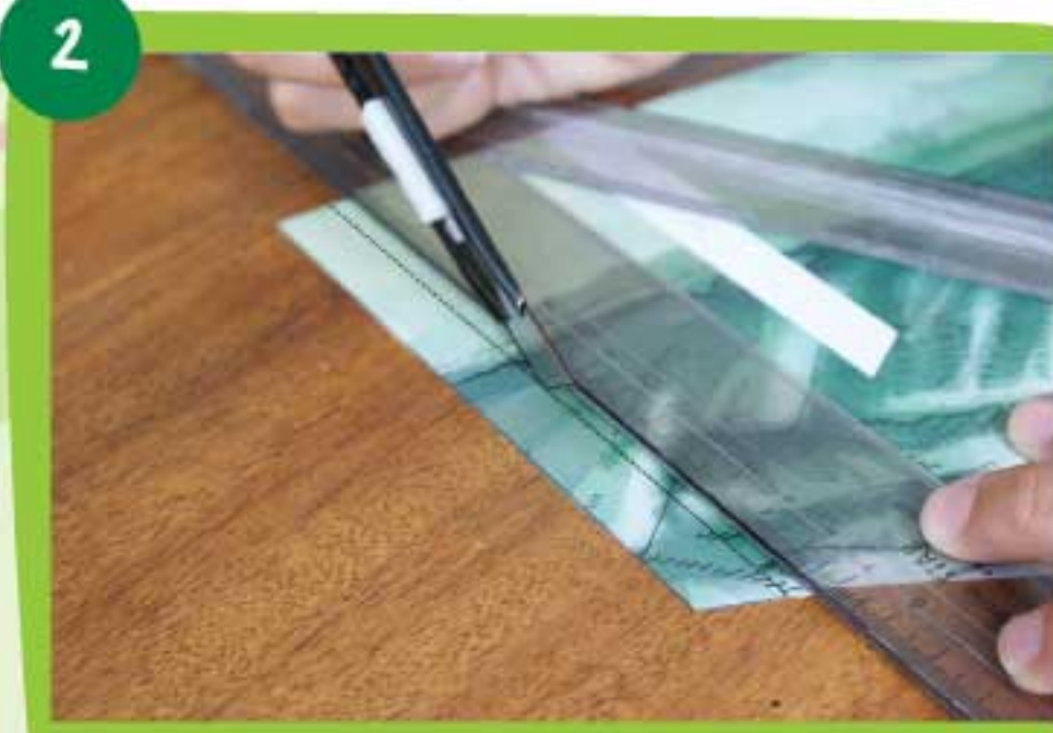
Por la línea punteada marca las solapas con la parte no afilada de una cuchilla.