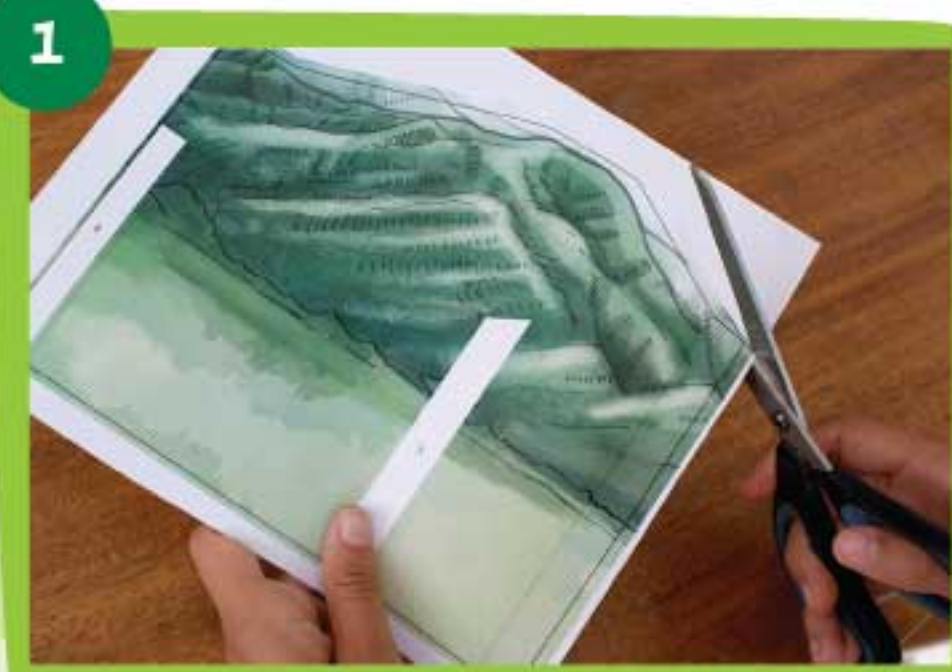
Recorta con cuidado la pieza Pittier 1 siguiendo siempre la línea negra exterior.