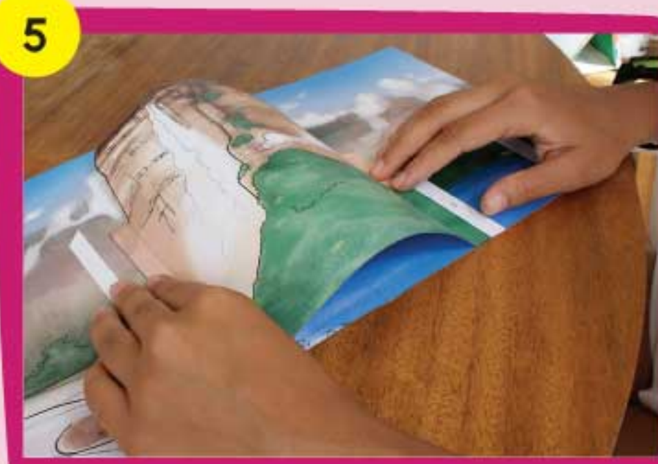
5 Coloca cada solapa en los espacios identificados con el N° 1 sobre la base. Mantenlas firmes hasta que sequen.