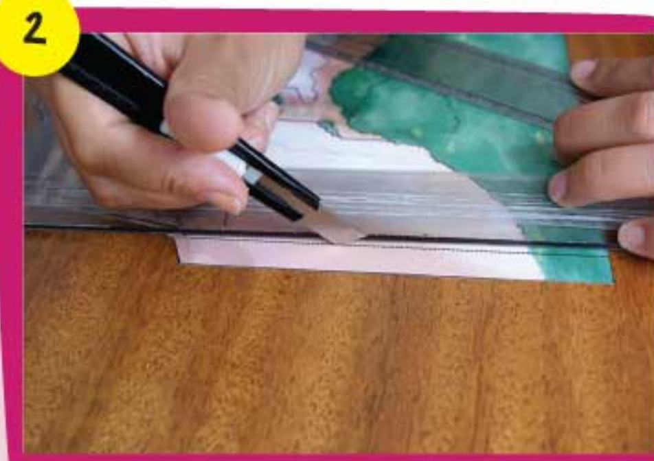
2 Por la línea punteada marca las solapas con la parte no afilada de una cuchilla.