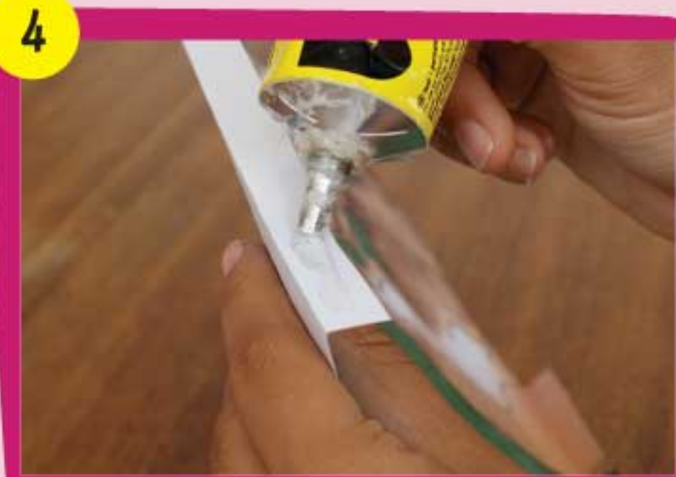
4 Coloca pegamento en el reverso de cada solapa de la pieza Canaima 1.