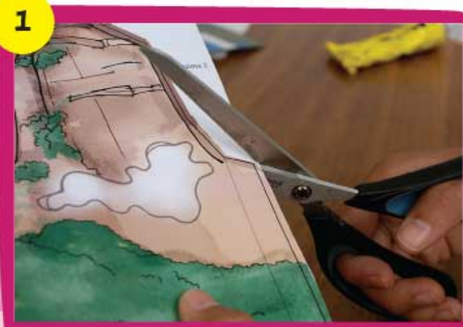
1 Recorta con cuidado la pieza Canaima 1 siguiendo siempre la línea negra exterior.