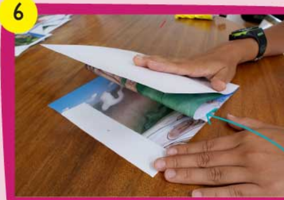
6 Dobra la base con cuidado hasta que logres comprimir la pieza Canaima 1 y generar el doblez en la mitad de ella.

Sigue los pasos del 1 al 6 con cada una de las piezas del parque. Recuerda siempre mantener el orden de numeración de las piezas. Pega el águila arpía donde más te guste.