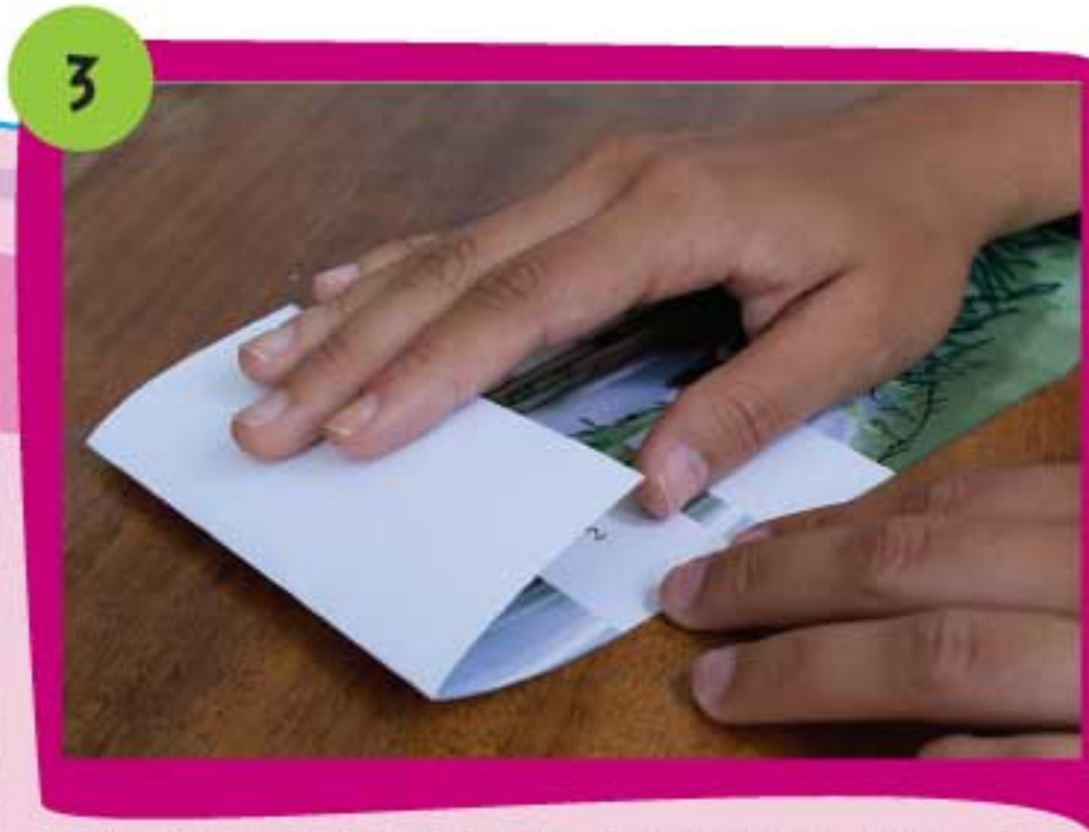
3 Realiza los dobleces de cada solapa de la pieza Parima 1 siguiendo la línea punteada.