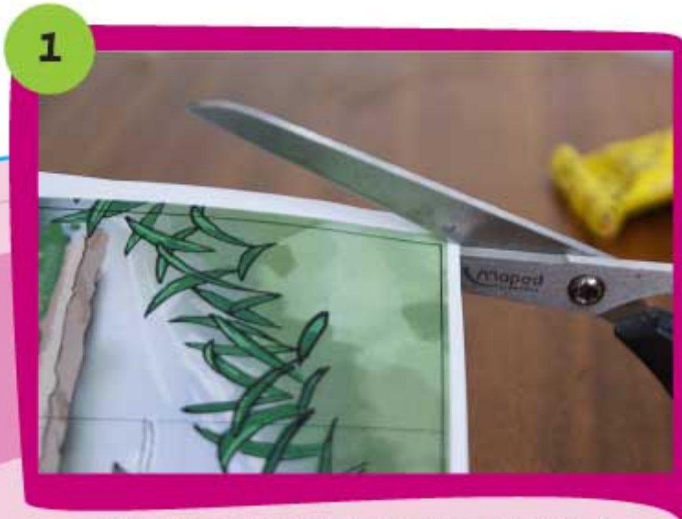
1 Recorta con cuidado la pieza Parima 1 siguiendo siempre la línea negra exterior.