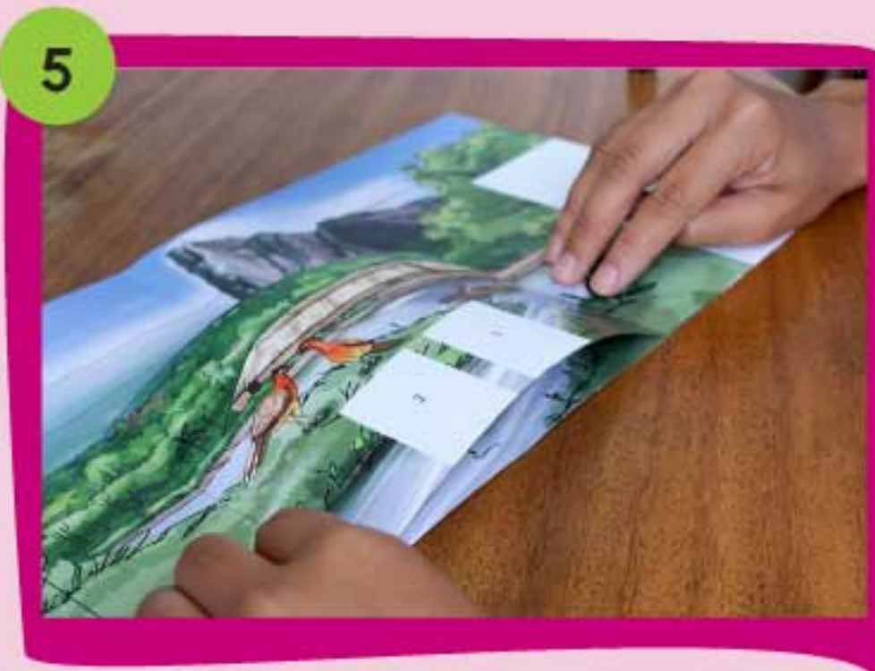
5 Coloca cada solapa en los espacios identificados con el N° 1 sobre la base. Mantenlas firmes hasta que sequen.