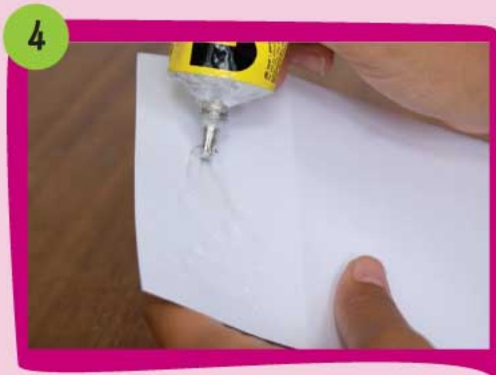
4 Coloca pegamento en el reverso de cada solapa de la pieza Parima 1.