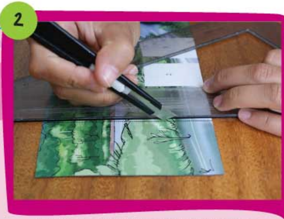
2 Por la línea punteada marca las solapas con la parte no afilada de una cuchilla.